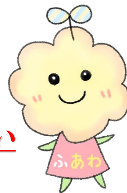
とくしま子どもの居場所づくり キャラクター「ふあわ」

徳島県社会福祉協議会に「子どもの居場所づくり推進コーディネーター」を配置し、地域におけるこどもの居場所づくりを進めることとなりました。