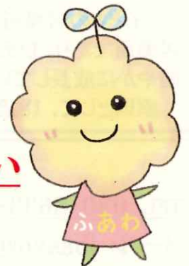
とくしま子どもの居場所づくり キャラクター「ふあわ」

徳島県社会福祉協議会に「子どもの居場所づくり推進コーディネーター」を配置し、地域における子どもの居場所づくりを支援しています。